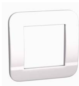
Plaque de finition G1PL