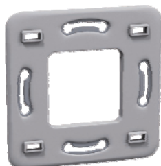
Grille de fixation G1GR