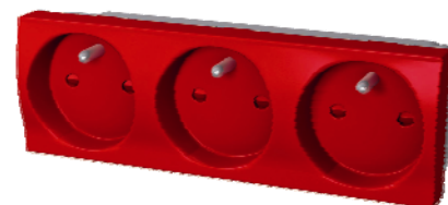
Bloc 3 prises de courant sécurisées G1PCSR