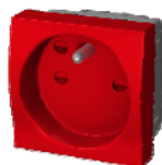
Prise de courant sécurisée G1PCSR